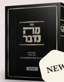
מטח ספר 'מטה' דברי' - פסק הלכות מתוך שיעורי הלכה של הגאון רבי משה דיענבאט שליט"א, מאת הרב יהודה אריה הלוי העב"ר שליט"א

ה. אמנם מי שיש לו כויה (burn) פעמים הוי חולה שיש בו סכנה או על כל פנים חולה כל גופו, ולכן מותר לסוך הכויה בשמן. אבל אם אינו קואב כל כך אסור לסוך אותה בשמן, אבל מותר לשפוך מים קרים עליה, דזה אינו ניכר דהוי בשביל רפואה.