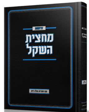
קטע מחוך דרשות מחצית השקל

וליישב קושיית רבי יהושע בן לוי לאלוהו ביום הכיפורים אמאי לא אתי משיח דכל ישראל שבו בתשובה (יומא יט, ב). יש לומר דהיא תשובה של רמאות, בשעת תפילה אנו מבטחים שלא לשוב לכסלה. ומיד אחר יום הכיפורים שבים לכסלה. ויש גם בשעת היודי עצמה שהיא רק ויודי פה, לכן אמר שוא וכו' והוא על לשוננו בשעת תשובה ויודי והם רק דברי שוא ואין מקיימים הבטחתינו. וגם ביקש אמת היא התורה ואין ולכן רחקה מאתנו מלוכה כי אין [- את אחד] מהדברים הגורמים גאולה.