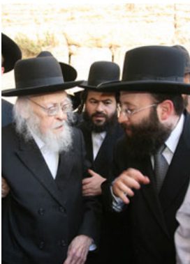
continued on pg 3