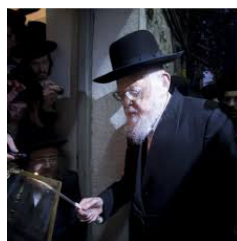
הגרי"ש אלישיב זצוק"ל