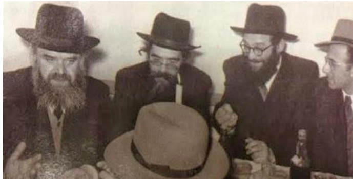
משמאל לימין: הרב חיים שמואלביץ, הרב אליעזר שך, הרב שמואל רוזובסקי זצ"ל, ולהבלח"ט הרב דוב פוברסקי שליט"א