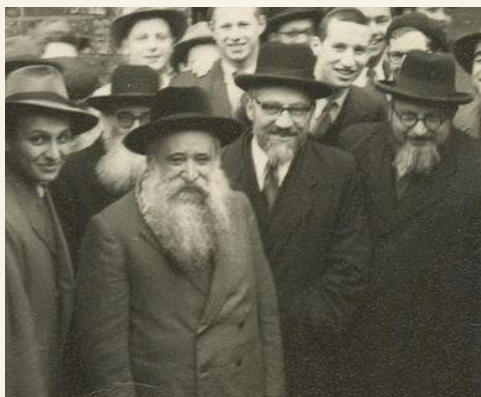
הג"ר יחזקאל אברמסקי זצ"ל - חזון יחזקאל

לדעת מו"ר הגר"ח קניבסקי שליט"א - מותר ליכנס עם בגדי כהונה בבית הכסא, דאל"ה בא לידי חשש בל תשקצו.