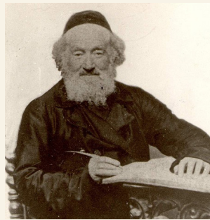
Rabbi Shmuel Strashun - Rashash