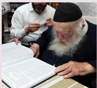
הגאון רבי חיים שליט"א מעיין בספר מנחה קטנה

עוד דנו דאם שולח מנות לרבו אולי קיים רבו מצות משלוח מנות מדין קבלת אדם חשוב, ובשו"ת זקן אהרן [סי' רי"ד] עמד בזה ופשט דלא יצא יד"ח, דהא בעינן שיוכל לקנות צרכי סעודה ובהנאה זז א"א לקנות שום צרכי סעודה, ומאיך גיסא בסי' ארוחות חיים [סי' תרצ"ה אות י"א] הביא משם גדול אחד שיצא יד"ח. ובריטב"א מגילה [ז' ע"ב] כתב דפרוטה לא מהני למשלוח מנות ובעינן מנה יפה וחשובה, א"כ אין שום הוכחה מקדושינ דמהני ביה פרוטה. ולכא' לפי דעת אותו 'גדול אחד' יכול לומר רקוד לפני ויצא בההיא הנאה, וצ"ע לחלק בין הנאה הבאה ע"י מאכל. ומורי הקשה מצד אחר, דאי"ז ב' מנות שהרי הכל קבלה אחת, וכל זה צ"ע.