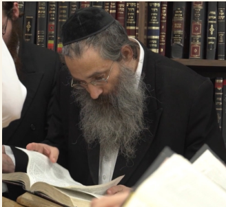
הרב אריה ברנשטיין שליט"א