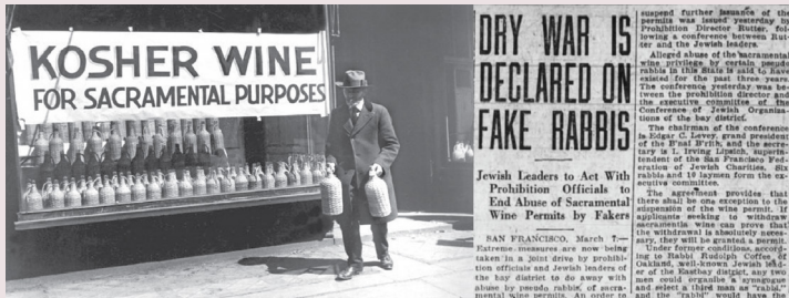
מתוך עיתון תקופת היובש

גם העיתונות היהודית, האמורה לשמור על כבוד ישראל שלא יתחלל בגויים, והיתה אמורה לעמוד בראש הלוחמים כנגד החוק המביא בושה וחרפה על יהודים, תחת זאת היא מגינה על כל נושא מכירת היין לקידוש בכזו התלהבות, שהלוואי שהיתה להם התלהבות כזו בשביל דברים חשובים יותר... העיתונות מכריזה בעקביות שהרבנים הם הקובעים את הדין ולא החוק הממשלתי הוא הקובע, זה אמנם נכון, אבל מדוע כאשר עולות לדיון שאלות יסוד כמו כמה מיליוני שנים קיים העולם, או האם האדם בא מן הקוף, או האם מותר ליהודי להתחתן עם גויה,