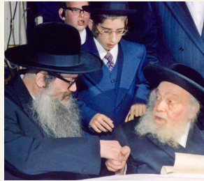
Tzelemer Rav with Debreciner Rav