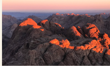
Sunrise in Sinai

One year, after reading the Tikkun, Rav Moshe Feinstein zt”l commented that the list of the Taryag Mitzvos in his machzor didn’t conform to any other count by the Rishonim.