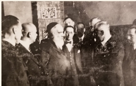
בעל מנחת אלעזר נפגש עם חברי הממשלה הצ'כית