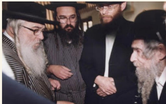
הגרי"מ ברנסדרפר זצ"ל עם הגרי"ל שטיינמן זצ"ל

אך לדינא הנני מודה קצת לדברי כת"ר מטעם אחר, דבאמת יש שאלה בכלל בטבילה בשבת בזמנינו (עי' מ"ב וביאור"ה סי' שכו ס"ח) מצד טענת התרוה"ד הנ"ל של"ש בזמנינו נראה כמיקר, ועוד דיש חשש של סחיטה. וא"כ ממ"נ אם הוא גברא שמקפיד