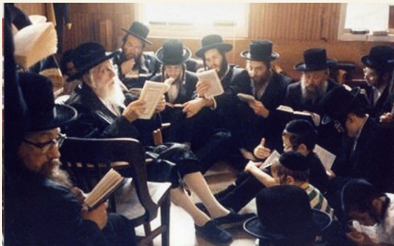
האדמו"ר מהר"ש מאבוב זצ"ל באמירת קינות

אסיים בדברי רמז שמצאתי בספר אור פני משה על הפסוק "ידוע תדע כי גר יהיה זרעך וגו' ועבדום ועינו אותם" (בראשית טו, ג), שיש בראשי תיבות אלו רמז לד' צומות וכ' סיון שנתקנו על שעבוד הגליות: "בטבת, ת'שעה באב, כ' סיון, ג' תשרי, י"ז בתמוז. ויה'ר שנזכה לסיפא דקרא "וגם את הגוי אשר יעבודו דן אנכי ואחרי כן יצאו ברכוש גדול".