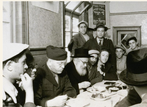
הג"ר יצחק אייזיק הלוי הרצוג זצ"ל ומאחוריו שלט "לזכרון נשמות הקדושים וכו"

בגליון 'עלים' לפרשת בהעלותך כתבתי מאמר (באנגלית) בענין יום כ' סיון, ובארתי שם בס"ד שבאמת קבעו קדמונינו ימים בשנה לזכר הצרות, ובפרט הזכרתי את תקנת יום כ' סיון שתקנו חכמי הדור בגזירות ת"ח ות"ט. וכתבתי עיקר הטעם שלא רצו לקבוע יום זכרון על הצרות בחורבן יהדות אירופה, מטעם שאפשר לתקן דוקא יום צום לתשובה ותפילה וצדקה, אבל לתקן יום של אבילות ובכיה כמו תשעה באב - זה אין לעשות.