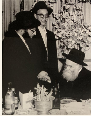
הג"ר אהרן קוטלר עם בנו הג"ר שניאור

ועוד אמר לי הגרי"א הכהן פארכהיימער שליט"א בשם הגרי"ח ש קוטלר זצ"ל, דשיטת הגרי"א קוטלר זצ"ל היא שדין ברכה הסמוכה לחברתה הוא רק כשתי הברכות שייכות זו לזו, וכמו בסוגיא דכתובות לענין שבע ברכות, אבל בשאר דוכתי אין ברכה נפרדת נחשבת סמוכה לחברתה. ואמר הגרי"א הכהן פארכהיימער שליט"א דלפ"ז א"צ לסמוך תפילת הדרך לברכה אחרת, שהרי אינה שייכת לברכה שלפניה.