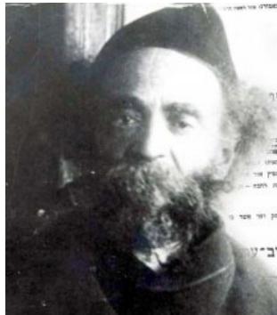
בעל 'צפנת פענח' בצעירותו

חילוק בין ואפשר לומר, דהנה המעלה קרבן בחוץ אזהרתו מקרא ד"השמר העלאה לשחיטה" לך פן תעלה עולותיך בכל מקום אשר תראה", אבל השוחט בחוץ לא כתיב אזהרתו להדיא, וילפינן לה מגזירה שוה, כמבואר בזבחים (קו, ב), וא"כ נראה דהך תנאי ד'אשר תראה' שנתחדש שמעיקרא לא נאסר עפ"י נביא, זהו רק באיסור העלאת קרבן בחוץ, אבל באיסור שחיטת חוץ ליכא להאי דינא, ולא התנה בו הכתוב מעולם דעפ"י נביא מותר. ולפ"ז י"ל, שדברי הספרי דמעשה דאליהו היה מדין "אליו תשמעון" הכוונה על השחיטה בחוץ [וכמשמעות תוס' יבמות (ז, ב) ד"ה ליגמר], ולא על ההעלאה, דההעלאה מעיקרא לא נאסרה ע"פ נביא דילפינן מ"אשר תראה", וכנ"ל. וכן הוכחת הגמ' ביבמות שניתן לעקור ד"ת למיגדר מילתא, היא רק משחיטת חוץ, אך ההעלאה מעולם לא נאסרה ע"פ נביא ואין להוכיח מאליהו.