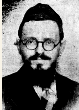
בעל ציץ אליעזר בשנת תש"כ

ולפי זה יש ליישב סתירת הרמב"ן, דלעולם ס"ל דלא מהני תשובה לומר שאין לקרותו רשע למפרע, דבדואי באותה שעה עדיין היה רשע, ולפיכך תרח נקרא רשע. אבל מכל מקום מהני התשובה לתקן את השנים שלא יהיו פגומות ונדחות, אם עשה תשובה מאהבה. וס"ל להרמב"ן דישמעאל עשה תשובה מאהבה, ולפיכך יש למנות שנותיו. ומה שכתב דשנותיו לא היו שוין לטובה, היינו משום דלמעשה היה רשע באותן השנים. אך מפשטות לשון הרמב"ן שכתב שנמנו שנותיו משום "שהיה צדיק בעל תשובה וסיפר בו כדרך הצדיקים", משמע ששנותיו נמנו מפני שהיה צדיק, ולא מפני שהשנים נתקנו. ולכן נראה להציע באופן אחר, דאף שלא הועילה התשובה לעשותו צדיק למפרע מכל מקום כיון שהיה צדיק לבסוף, הרי הוא נחשב בחפצא כאיש צדיק, ודי בזה לזכות למעלת הצדיקים ששנותיהן נמנות בתורה. דאין הדבר תלוי בצדקתו באותן השנים, רק בתואר של האיש אם הוא צדיק או רשע, וכלשון הרמב"ן ש"דרך הצדיקים" היא ששנותיהן נמנות בתורה.