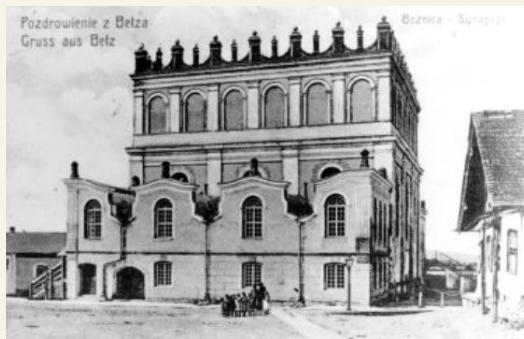
Bais Hakinesses in Belz built by the Sar Sholom

The Sar Sholom of Belz gave a different answer to why we quote specifically the passuk about Pesach Sheini at korech . Although at the Seder we can only make a zecher to the korban Pesach for korech , he said, we daven that by Pesach Sheini Moshiach shall have come, and we will be able to actually bring the korban Pesach and eat it with matzah and maror .