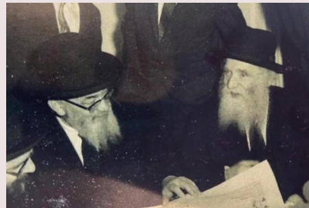
מרן עם הרב רודמן