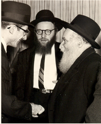
Rav Aharon with Rav Shneyor

Note: In the time of Rav Aharon, turning on electric lights (incandescent bulbs) was definitely an issur d'Oraysa of kindling a light. According to the Chazon Ish, it would be a melachah d'Oraysa because it involves building a circuit. Even turning on a fluorescent light may be a question of melachah d'Oraysa , because of the starter. Today, with LED bulbs, turning on certain lights may involve only a shvus and may therefore be permitted through a non-Jew for the sake of a mitzvah . However, due to the general laxity in the issur of amirah lakum , many Poskim take a stricter stance. A Rov should be consulted in each situation, as these halachos are complex.