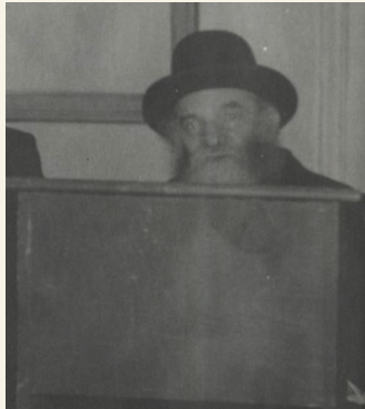
Rav Aharon at his shtender