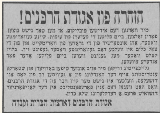
כרוז מאגודת הרבנים ד' סיון תשי"ט

נידון המכתבים הוא מריטת נוצות עופות שחוטים במים חמים. הנה קיי"ל, שלמרות שלא נאסר באכילה דם האברים שלא פירש לחוץ (ובשר חי מותר באכילה בלי מליחה), מ"מ באופן שפירש דם ממקום למקום, אסור באכילה (יו"ד סי' סז סעי' א). ועל כן, במקרה שנפל חתיכת בשר שלא נמלחה למים חמים שהיד סולדת בהם, חוששים שהחום גורם לדם לפרוש ממקום למקום, ונהגים לאוסרה באכילה (רמ"א יו"ד סי' סז סעי' יא, ש"ך שם ס"ק מד). על פי הג"ל, אסור למרוט נוצות עוף שחוט שעדיין לא נמלח, על ידי מים חמים שהיד סולדת בהם (יו"ד סי' סח סעי' י-יא). כבר הרדב"ז (ח"ד סי' אלף שיט) כתב לאסור מריטת הנוצות אפילו במים חמים שאין היד סולדת בהם, מאחר שעלול לבא לידי איסור, ובעידן המודרני, שהעופות השחוטים מעובדים בבתי חרושת על ידי פועלים נכרים, לפעמים ראו פוסקים לאסור מריטה בכל סוג מים חמים, אפילו כשאין היד סולדת בהם, מאחר שעלול הדבר לבא לידי קלקול.