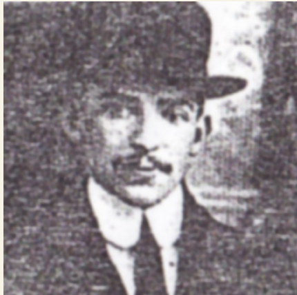
מרן כחתן לבתו של הגרא"ז מלצר זצוק"ל

תלמידים כאלה אפשר להעמיד רק אם המחנך מחדיר בהם את הגישה הנכונה, שידעו גודל יקרת ערך התורה, וגודל רוממות מעלת האבות הקדושים ושאר האישים שמדובר אודותם בתורה.