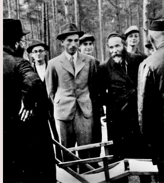
למעלה: הרב אהרן קוטלר בצעירותו למטה: הגר"ש מילר שליט"א

כג. כתב הגר"ש אויערבאך (שו"ת מנחת שלמה מהדו"ק סימן צא אות כ), שמסתברא דעל מה שלא נדר בפירוש, כגון מנהגי מצוה, יכולים שפיר לסמוך