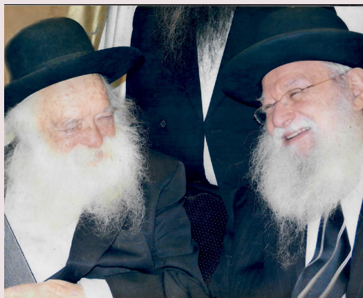
הגאון רבי דוד קאהן שליט"א עם הגר"ח קניבסקי זצ"ל