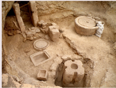
בית הבד עתיק שנתגלה במודיעין

ויראה עפ"י מ"ש החסיד בחובות הלבבות [שער אהבת ה' פ"ז] ז"ל, כי רוב השמן בנר היא הסיבה לכבות אורו ע"כ, וא"כ כפי מאי דמשיך במיעוט שמן הוא הידור בהדלקה שלא יכבה בשבת. ולפי"ז אף לדידן יהיה מעליותא בשמן שומשומין, וזה חידוש.