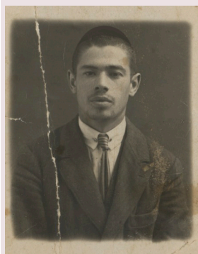
תמונת דרכון של הגרא"מ שך זצ"ל

What is the significance of Moshe's young leadership by Pharoh? Rashi answers this by citing Rabbi Yehudah. In the Talmud, Rashi notes (Beitza 26a) that whenever the Talmud mentions Rabbi Yehudah it refers to Rabbi Yehudah bar Ilay. It is related (Nedarim 49b) that Rabbi Yehudah was so poor that he and his wife had only one coat, which she made from wool. When she went to the market, she wore it, and when Rabbi Yehuda went to daven (pray), he wore it. This coat was not designed as a female garment (Maharsha). Yet, in spite of his dire poverty, the Talmud relates (Shabbos 33b) that the Roman emperor appointed him to be the first speaker at all functions, because he spoke favorably about the Romans. Later, Rabbi Yehudah became the director of the Nasi's home (Tosafos, Menachos 103b). Since he found grace in the eyes of the Romans, he received this prestigious position, although his personal status did not warrant it. The same is true regarding Moshe who was only twelve years old - and a Hebrew - yet, due to his unique qualities and endearing affinity to Pharoh's he gained esteem in Pharoh's palace and was thus appointed as an officer over his household.