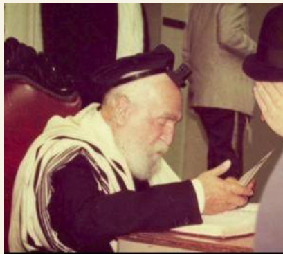
האגון רבי משה פינשטיין

אבל הרמב"ם בהלכות תלמוד תורה (פרק ג הלכה י) כתב וז"ל, "כל המשים על לבו שיעסוק בתורה ולא יעשה מלאכה ויתפרנס מן הצדקה, הרי זה חלל את השם ובזה את התורה וכבה מאור הדת וגרם רעה לעצמו ונטל חייו מן העולם הבא. לפי שאסור ליהנות מדברי תורה בעולם הזה. אמרו חכמים כל הנהנה מדברי תורה נטל חייו מן העולם. ועוד צוו ואמרו אל תעשה עטרה להתגדל בהן ולא קרדום לחפור בהן. ועוד צוו ואמרו אהוב את המלאכה ושנא את הרבנות. וכל תורה שאין עמה מלאכה סופה בטילה וגוררת עון, וסוף אדם זה שיהא מלסטם את הבריות". וכ"כ באריכות בפירוש המשניות (אבות פרק ד משנה ה).