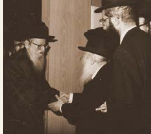
HaRav Yitzchok Weiss with HaRav Shach

A fundamental machlokes haPoskim , regarding both Shabbos foods and mevushal wine, concerns just what is a “cooked” food. Rav Moshe Feinstein zt”l ( Igros Moshe O.C. Vol. 4:74 #3, E.H. Vol. 4:108) maintained that the shiur of yad soledes bo [the hand recoils from the touch] is when a food is considered cooked, even if the liquid hasn’t come to a boil. In contrast, regarding both Shabbos food and mevushal wine, the Minchas Yitzchok (Vol. 7:61-62; Vol. 10:28) says “cooked” means boiling. (According to