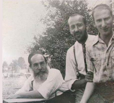
בעל אגרות משה בשנת תש"ה