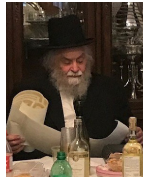
הגאון רבי שלמה מילר שליט"א