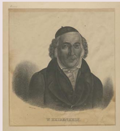
כהלל ולא כשמאי