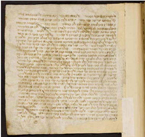
כת"ק של רס"ג

הקסמים ועטו על שפם כולם כי אין מענה" (מיכה ג, ז), ע"כ. וכן אמרו במו"ק (טו, א) שמפסוק זה למדו שמצורע אסור בשאלת שלום, "ועל שפם יעטה" - שיהיו שפתיו מדובקות זו בזו, שיהיה כמנהגו וכאבל, ע"כ. אך לעיל באותו עמוד למדו מפסוק זה שהמצורע חייב בעטיפת הראש, ובהלכות אבלות נקט רס"ג שהאבל "ילך מכותה ראש רכון" ואם כן פירש שם את הכתוב כפשוטו, וגם בפירוש עשר שירות, בפירוש שירת דבורה (שופטים ה, ב) כתב שכיסוי הפה הוא דרך הכנעה וצער, כמו שנאמר "ועל שפם יעטה", ויתכן