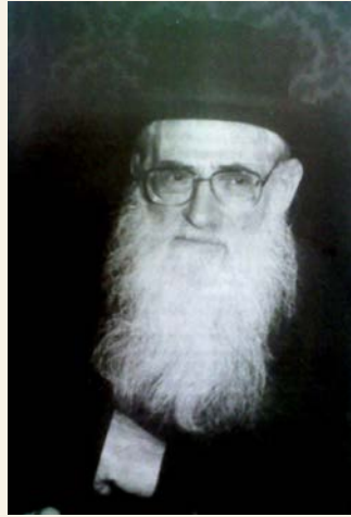
Rav Chaim Friedlander zatzal

When Hashem decides the fate of animals and objects, His Hashgachah Klalis decision determines the amount of each item necessary for avodas Hashem and kevod Shamayim in this world. Sometimes the connection of these objects to kevod Shamayim is direct and obvious (such as the cow needed for hide to make retzuos on a pair of tefillin); other times, the connection is less direct (such as the metal needed for the eye of the shoelace of the migrant worker who will process the coffee which will be shipped across the ocean to land up in a yeshiva bachur's cup). Either way, kevod Shamayim will be the determining factor.