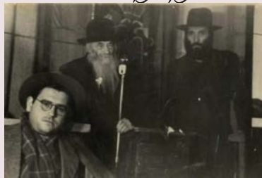
הגאון רבי איסר זלמן מלצר זצ"ל