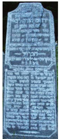
מצבתו של הגדול מיינסק זצ"ל - בעל אור גדול

וביאר בזה מה דעשו ק"ו מהצפרדעים, דכיון דלא היה קידוש ה' גמור לא היו מחוייבין מדינא ומשום קרא ד"אך את דמכם" (בראשית ט, ה), אלא דדרשו ק"ו דהיכא דאיכא קצת קידוש ה' שפיר דמי להחמיר, וקרא ד"אך את דמכם" לא קאמר רק היכא דליכא קידוש ה' כלל, עכ"ל. ולדבריו אתי שפיר אה"נ דיש חילול ה' אילו פלחו וכלשונו הגמ' "אנו שמצווין על קידוש השם", אבל לא חילול ה' "גמור" ולכן מעיקר הדין לא היו מחוייבים למסור נפשם, ורק למדו ק"ו מצפרדעים למסור נפשם עבור קדושת השם בכה"ג שרק היה קצת קידוש השם.