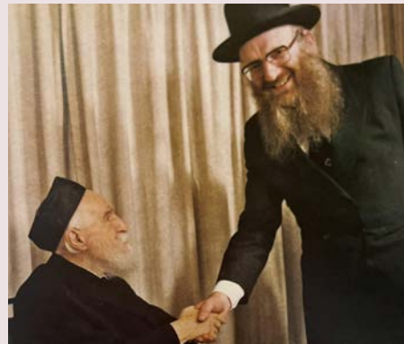
מורינו המשגיח זצ"ל עם הגרמ"פ זצ"ל