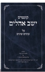
הרב ישעיה שמשון ברוננער