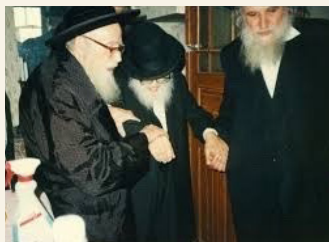
הגר"ש אייזנבאך זצ"ל. הגרא"מ שך זצ"ל. והגר"ש אייזנבאך זצ"ל

והעולה מהנ"ל, דלהנב"י ודעימיה מותר לאדם להכניס עצמו לצורך פרנסה אפילו למצב של סכנה ממש, אך לפי האגרות משה יתכן שלא הותר אלא אם הוא צד רחוק כגון אחד מכמה אלפים. ומאידך גיסא מרעק"א ועוד משמע דצד סכנה של אחד מאלף לא חשיב סכנה כלל - ולכל אדם מותר להכניס עצמו למצב כזה. וצריכים לברר מה אכן חשיב מצב סכנה לפי רעק"א. ובמושכל ראשון נראה שתלוי במנהגו של עולם, דכל מה שדרך העולם לא לחוש לו, נכנס בכלל "שומר פתאים ה'" ולא מיקרי סכנה. וכן לכאורה מוכח מהסוגיא בברכות דארבעה צריכים להודות, ומהם יורדי הים והולכי מדבריות, מבואר להדיא דאף דחשיב מקום סכנה - שהרי צריך להודות, מ"מ מותר ללכת שם, ומשמע דמותר בכל אופן גם שלא לצורך פרנסה, ובע"כ דכיון שכן הוא מנהג העולם שוב לא חשיב הדבר כמצב סכנה שייאסר לו לעשותה, ומהאי טעמא מותר לנסוע באוירון ובמכונית. ומעין זה כתב בשו"ת מנחת שלמה [ח"ב סימן ל"ז].