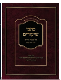
הג"ר שמואל אבא אלשין/ הרב רחמים שורבה כהן