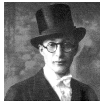
הגר"ח"פ שיינברג זצ"ל