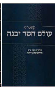
הרב יעקב חיים קיר