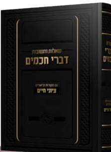
הרב חיים אריה זאב גינזבורג