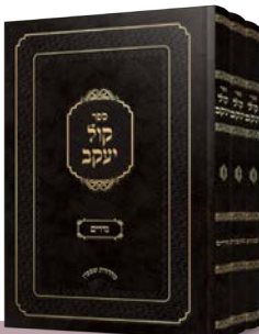
הג"ר יעקב פרומאן