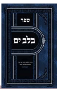
הרב יוחנן מעגעצער