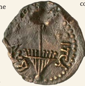
Perutah from the reign of Agrippa

Rivash and many Acharonim clearly do not feel that this is the case, yet unlike the Sema, they hold that the value of the perutah remains constant. This is similar to what the Chazon Ish writes (YD 5:50) that the laws of tereifos are established according to what was the reality in the time of Chazal. Similarly, בשכבך and ובקומך are defined according to what people did in the time of the Mishnah [see, however, Rav Yosef Chaim Sonnenfeld ( Toras Chaim 23), that the definition of בשכבך and ובקומך does change], and so too the shiur of perutah remains constant.