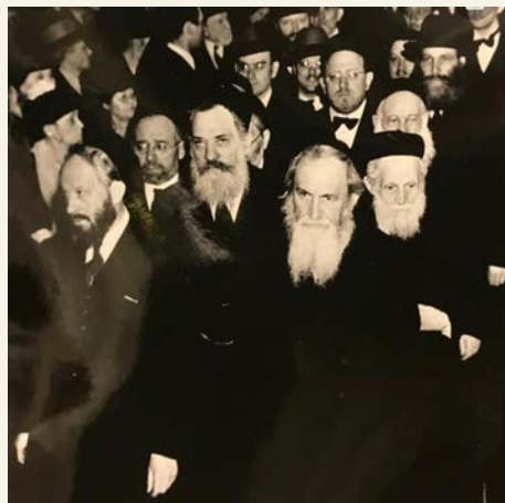
הגר"מ סאלאוויצ'יק זצ"ל (השני מימין)