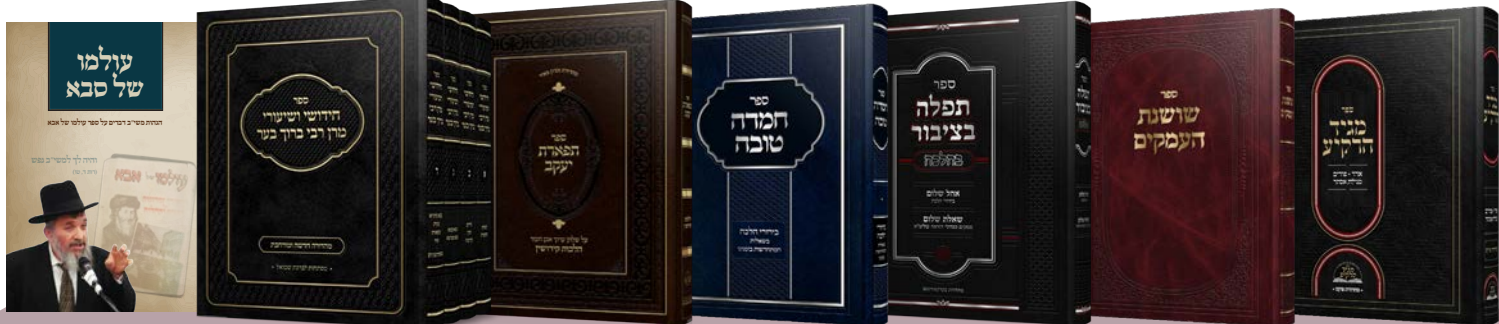
הרב דניאל יעקב גלאטשטיין / הרב ישראל יעקב פאר זצ"ל / הרב שלום צבי גרינפעלד / הרב חיים דוב הלפרין / הרב יעקב געזונדהייט זצ"ל / הרב גר"ר ברוך בער לייבאוויץ זצ"ל / הרב מרדכי שמואל ינתן בערקאוויטש ז"ל / הרב חיים מאיר בערקאוויטש