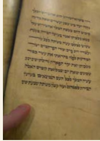
The Bnei Yissaschar's megillah